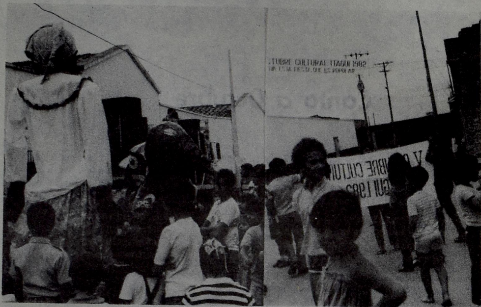
Las labores educativas y recreativas del Octubre Cultural Itagüí resaltan en cualquiera de nuestros barrios.

Este Itagüí donde el estar juntos es distancia donde Antioquia se ha reunido en el silencio. Donde la intimidad es canto-pausa y la frialdad es calor reservado hacia el mañana. Donde el mundo se dio cita para entender su causa. Ha gestado la flor simple esperanza donde el humor no es hoy, mas será jugoso reír de madrugada. Este Itagüí, amor, en trasnochadas y en días sin tiempo será lecho febril para los hijos.