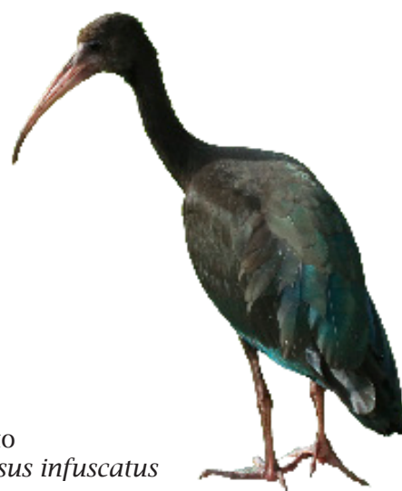
Coquito Phimosus infuscatus

Es fundamental apreciar a los alados porque desconocemos aspectos importantes de su fisiología, apariencia, sonidos, taxonomía y con estos temas poder llegar a la población desde conocimientos adquiridos por la investigación permanente y la colaboración de profesionales en el área ambiental y de educación, iniciando con la Ornitología por el conocimiento y evidencias del estudio de aves en el DMI.