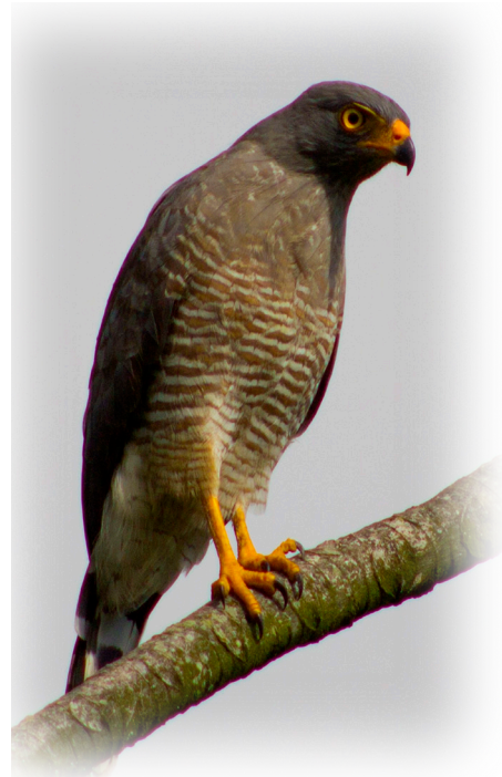
Gavián caminero Rupornis magnirostris