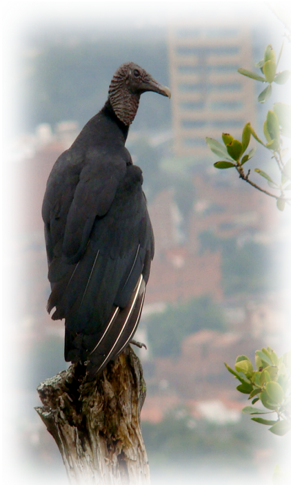
Gallinazo Coragyps atratus