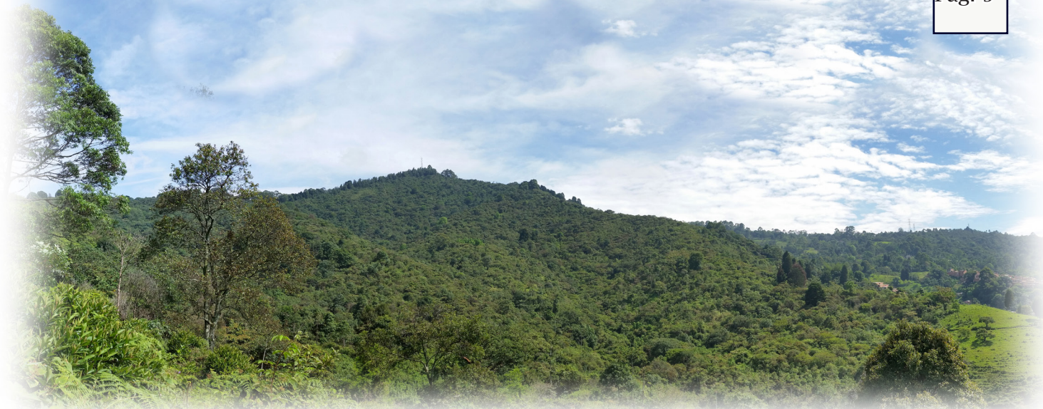
Cerro Tutelar Pico Manzanillo