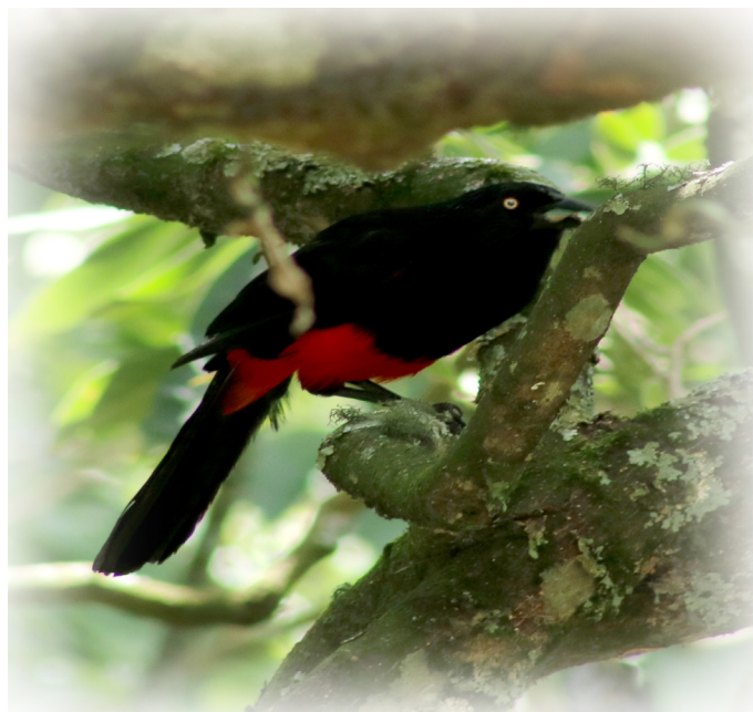
Cacique Candela Hypopyrrhus pyrohypogaster