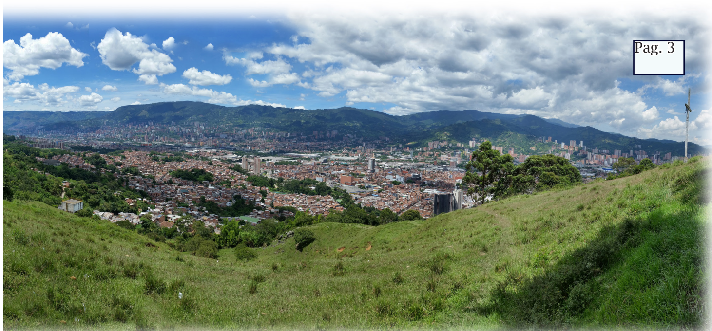
Panorámica de ciudad desde la Loma de Los Zuleta