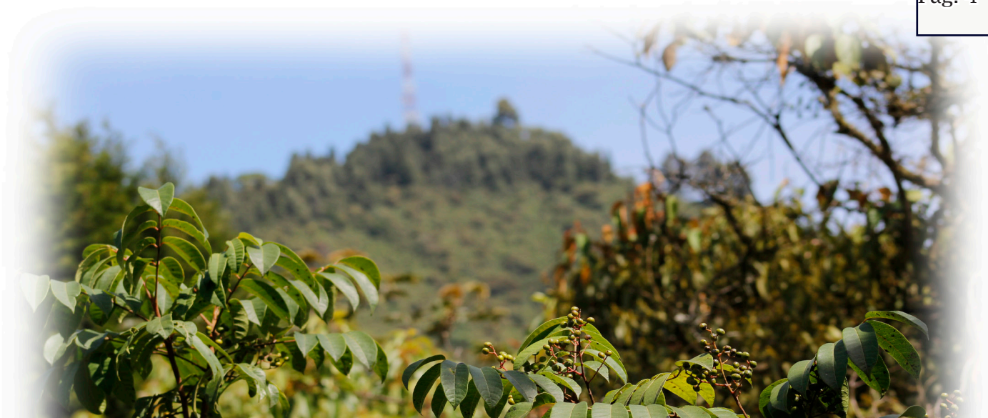
Cerro Tutelar Pico Manzanillo