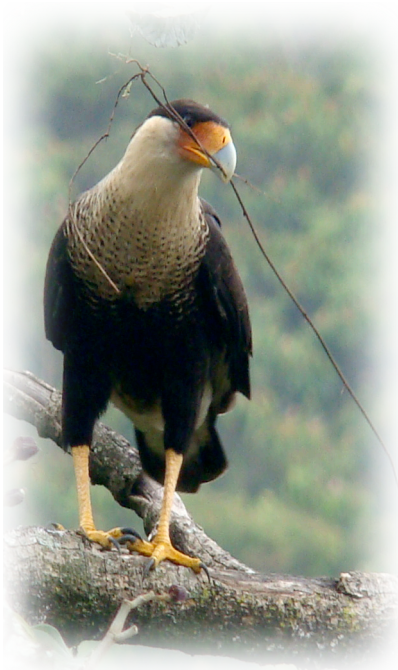
Carancho Caracara plancus