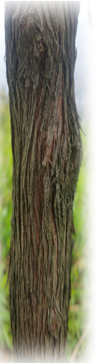
Galan de noche (corteza) Pittosporum undulatum

En la actualidad y a pesar de la cercanía a la zona urbana se desconoce por muchos ciudadanos las bondades que nos ofrece el área protegida en el municipio. No obstante esta información estará disponibles para aquellas personas que quieran conocer sobre la naturaleza y sus formas en la región.