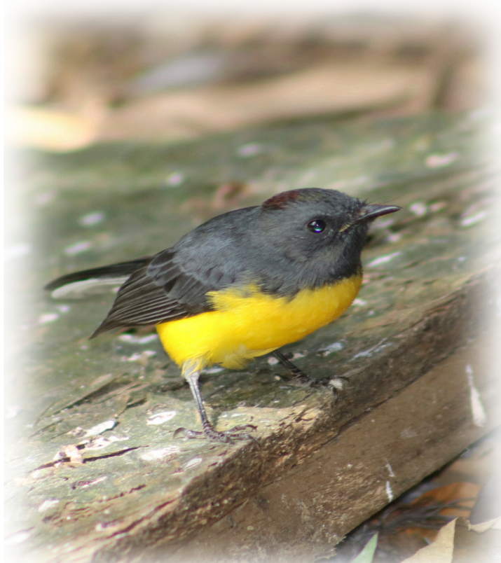
Abanico pechinegro Myioborus miniatus