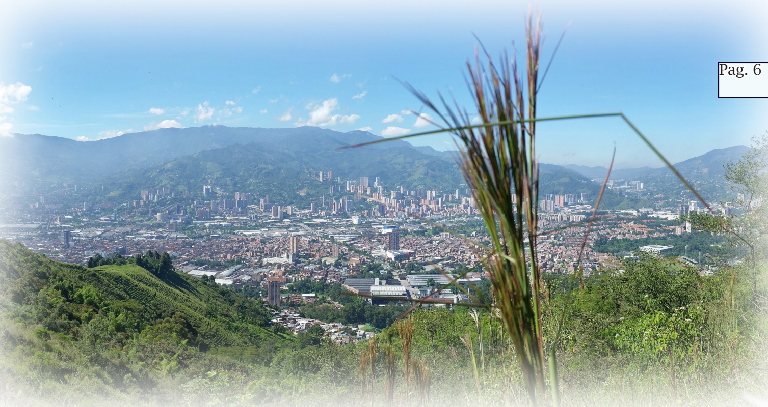
Panorámica de ciudad desde el predio Olivares