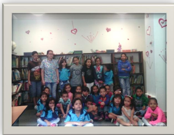
Ilustración 2

Las actividades antes mencionadas son técnicas en las que se apoyan los lecto-juegos, las cuales fueron diseñadas para grupos entre 15 a 25 personas, programadas para realizarse inmediatamente después de la lectura en voz alta y practicarse en el mismo espacio de lectura. Fueron seleccionadas específicamente para ayudar a la formación de lectores y en la medida que ellos se divierten asimilen mejor la narración lo cual genera interés por otras obras y motivación