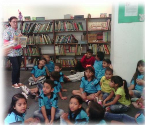
Ilustración 9

Durante mi práctica iniciaba la hora del cuento con los conocimientos previos que tenían los niños, con una serie de preguntas analizaba si contaban con los elementos necesarios para la comprensión del texto o por el contrario tenían conocimientos reducidos, nulos o equivocados, mi papel como docente en muchos casos fue promover la ampliación de conocimientos para aumentar el entendimiento del texto y en otras ocasiones fue generar interrogantes que iban a ser resueltos durante la lectura. Este tipo de conversatorios facilitaba la producción de respuestas