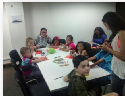
Ilustración 8

“La comprensión lectora es una de las habilidades básicas que deben desarrollar las personas para poder decodificar los mensajes escritos. A través de esta lectura adquirirás las herramientas necesarias para aplicar distintos tipos de lecturas de acuerdo con el material que estás revisando y a los objetivos planeados para su lectura. Además analizarás los distintos textos que existen, su intención comunicativa y la lectura de otros códigos” (Quijada, V. 20014). La comprensión lectora es un proceso de interacción entre el pensamiento y el lenguaje que permite elaborar un significado por medio de las ideas relevantes de un texto y relacionarlas con los conceptos que ya tienen un significado para el lector. El desarrollo de la comprensión resulta fundamental, pues esta actividad cognitiva posibilita un sinnúmero de aprendizajes que tienen que ver con el desarrollo de la competencia comunicativa, el fortalecimiento de los procesos cognitivos y el enriquecimiento del imaginario del niño.