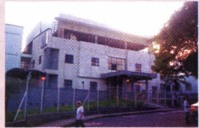
Hospital del Sur

A nivel interior del barrio, se ha carecido de centros de salud, públicos o privados, y era así como se debían desplazar quienes tenían una mejor posición económica a otros lados del