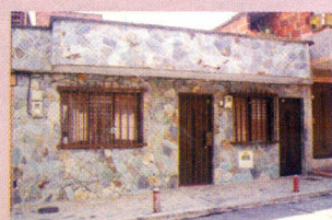
En esta casa ubicada en la calle 31 # 44-61, vivió el hoy alcalde de Itagüí, Dr. Carlos Arturo Betancur Castaño.

La llegada del primer carro en 1957, la construcción de la nueva Iglesia, del centro comunitario, los paros cívicos, entre ellos el primero realizado en el municipio de Itagüí, el 3 de noviembre de 1982.