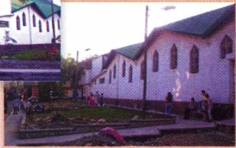
Costado lateral de la Iglesia San Pío X