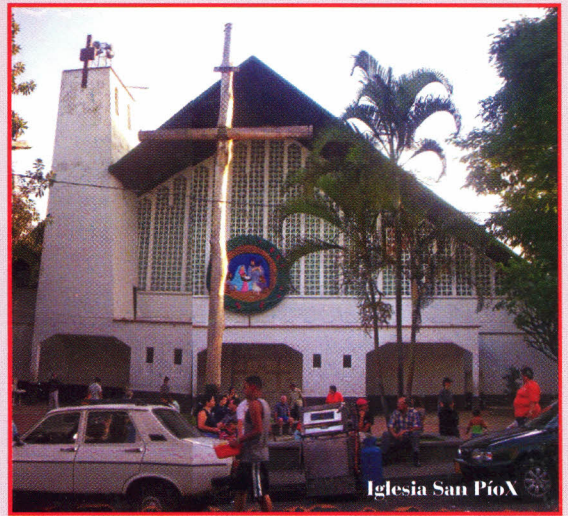
Iglesia San Pío X

Hoy en sus límites se cuenta con el Hospital del Sur.