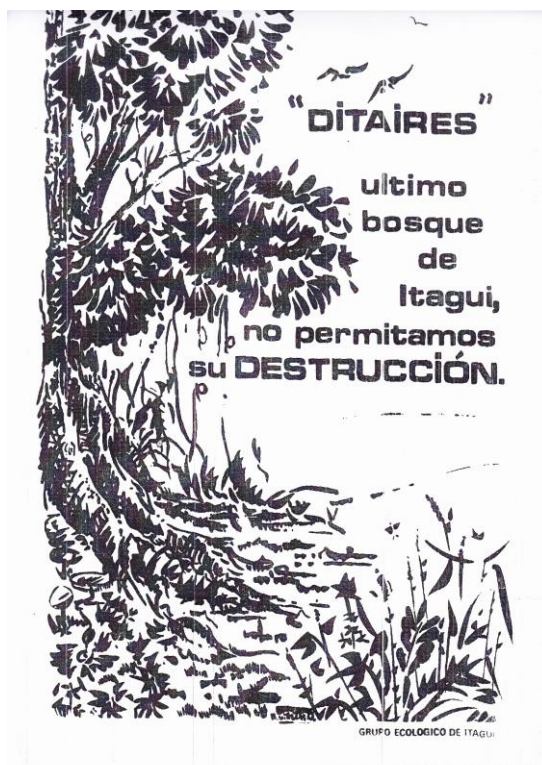
Imagen N 10