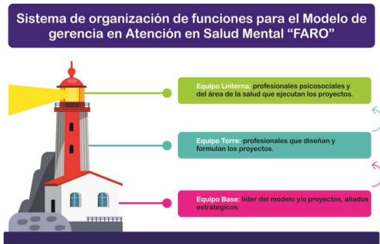
Figura 2. Sistema de organización de funciones para el Modelo de Atención en Salud “FARO”