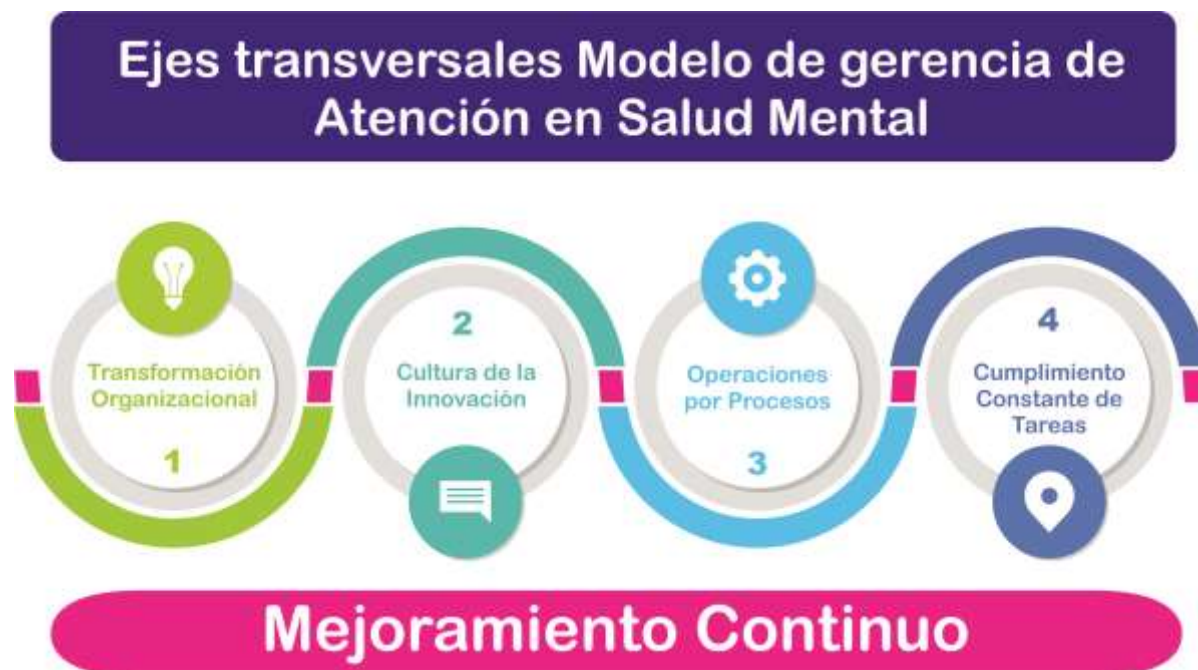
Figura 1. Ejes Transversales Modelo de Atención en Salud Mental