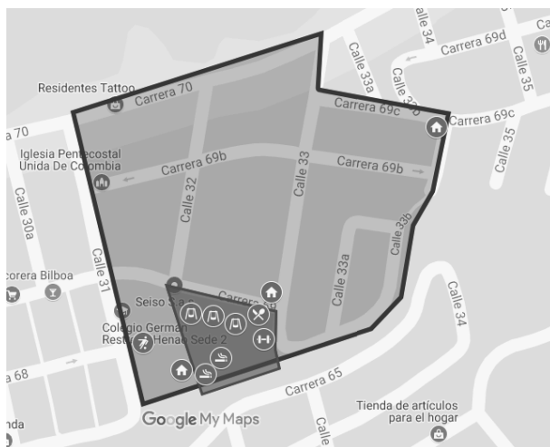
Figura 1: Mapa del Barrio San Antonio, Itagüí. Elaboración propia.

“La Limona” y el corregimiento de San Antonio de Prado, por el oriente con el barrio San Gabriel y al occidente con el barrio Triana. Aunque el barrio usualmente no es reconocido con dicho nombre, sino con el de San Gabriel.