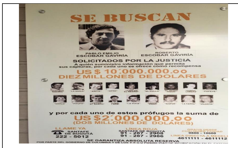
Imagen 6 Los más buscados

En esta última actividad se les presentó a los estudiantes la imagen empleada en la identificación de ideas previas, el afiche de Los más buscados , contribuyendo en la resignificación de estas ideas por parte de los estudiantes, así como en la contrastación del nivel de interpretación entre el momento inicial y final de la unidad didáctica (ver Imagen 6).