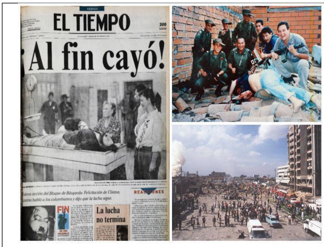
Imagen 3 La caída de El Patrón

cumplido 44 años el día anterior, completamente descalzo, rodeado de algunos agentes del Bloque de Búsqueda que aparecen sonrientes al cumplir el objetivo de dar de baja al máximo cabecilla de El Cartel de Medellín. La tercera fotografía, ubicada en la parte inferior derecha, corresponde al atentado perpetrado contra el Departamento Administrativo de Seguridad (DAS), el 6 de diciembre de 1989, por órdenes de Escobar (ver Imagen 3).