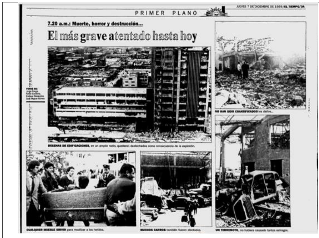
Imagen 4 Uno de los ataques de El Patrón