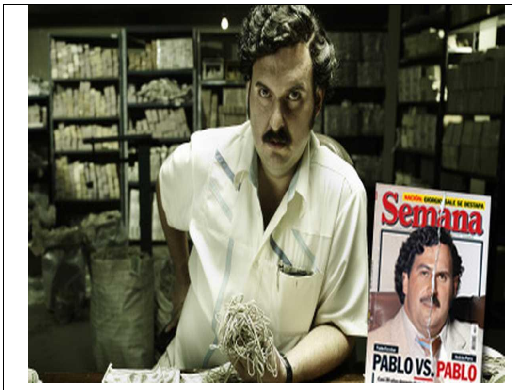
Imagen 2 Pablo Escobar, El Patrón del mal

fotógrafo al captar la imagen era “poder tener fama por tener una foto de Pablo, ya que era uno de los criminales más grandes y más buscados”. Así mismo, este estudiante consideró que la imagen es real y que “todos los elementos de la imagen lo son, menos la foto más grande que es de la historia donde se habla de él y también la revista que ha tenido modificaciones” (ver Tabla 4).