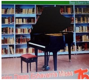
Foto 3. Web Bibliodem: http://bibliodem.org/sitio/ Consultado febrero 18/2024