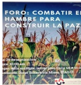
Foto 2.