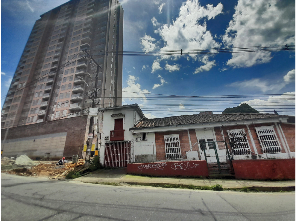
Fotografía: Contrastes urbanísticos, calle 31, Itagüí Año: 2022