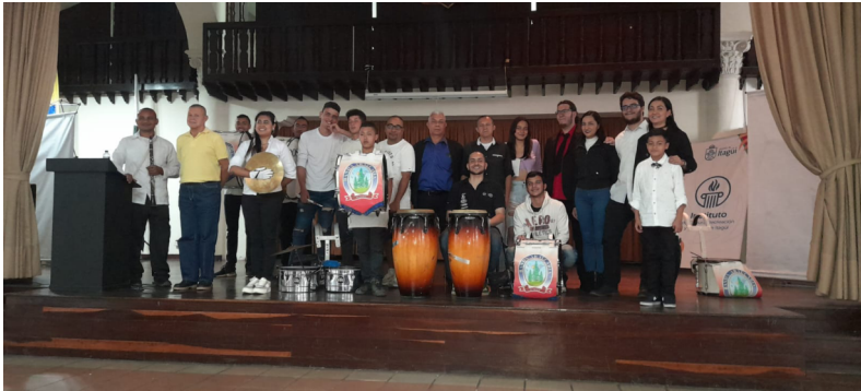
Fotografía: Banda músico-marcial “La Araucaria” Archivo fotográfico: Banda músico-marcial “La Araucaria” Año: 2022