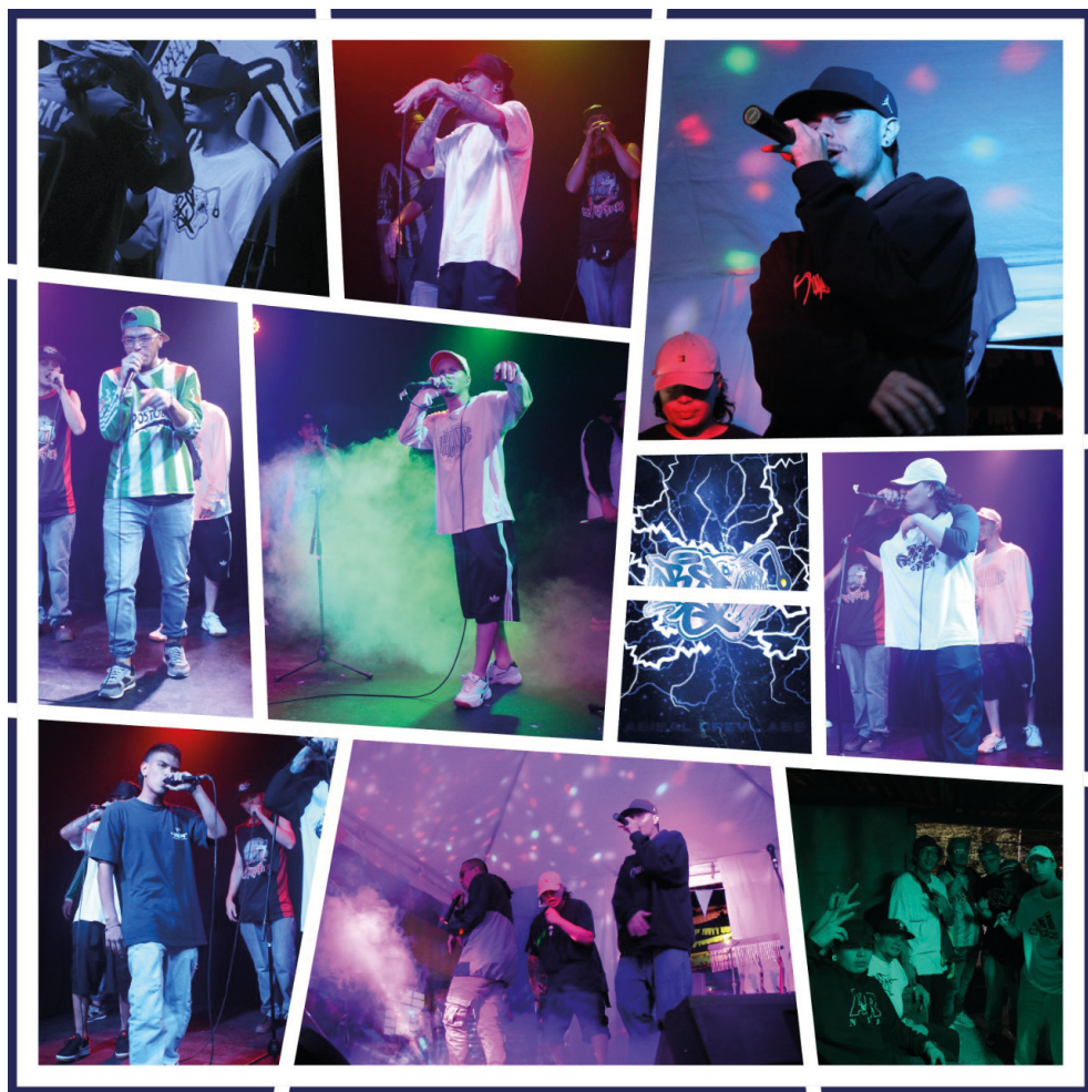
Año: 2022