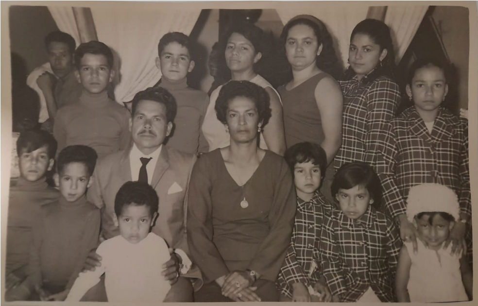
Año: 1971