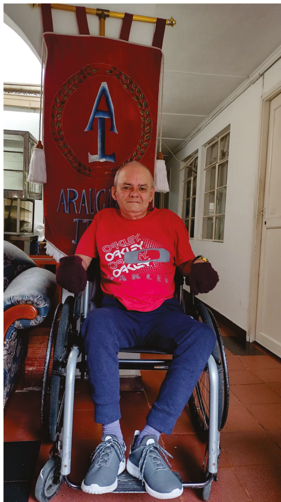
Fotografía: Argiro Molina (QEPD) Archivo fotográfico: Banda músico-marcial “La Araucaria” Año: 2022