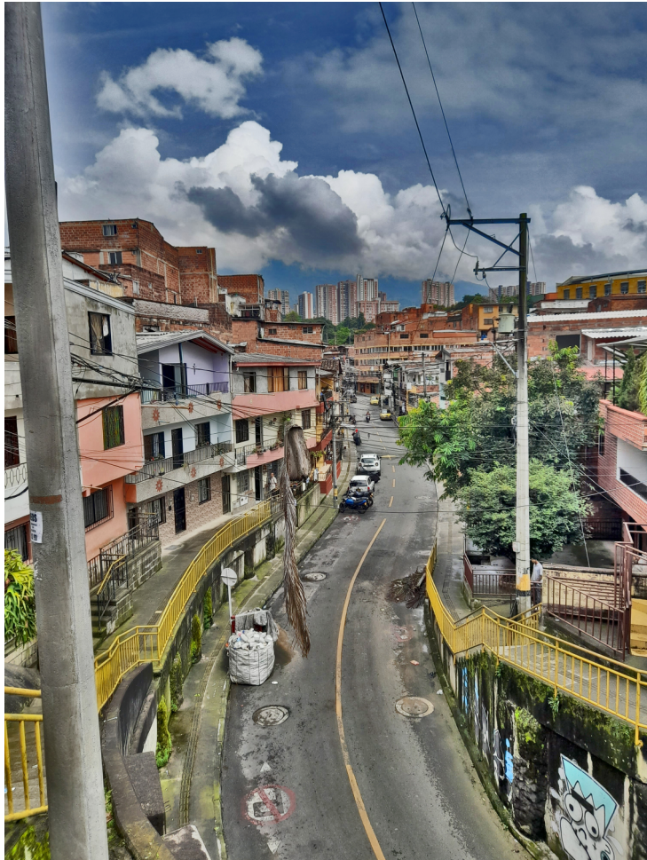
Fotografía: Barrio Santa Catalina - Calle Año: 8 de julio de 2022