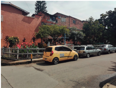
Jardín central de Guamalito.