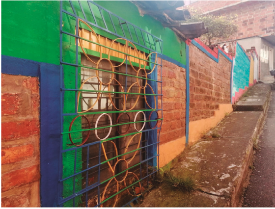
Mural memoria histórica de Guamalito. Autor: Hernán González.