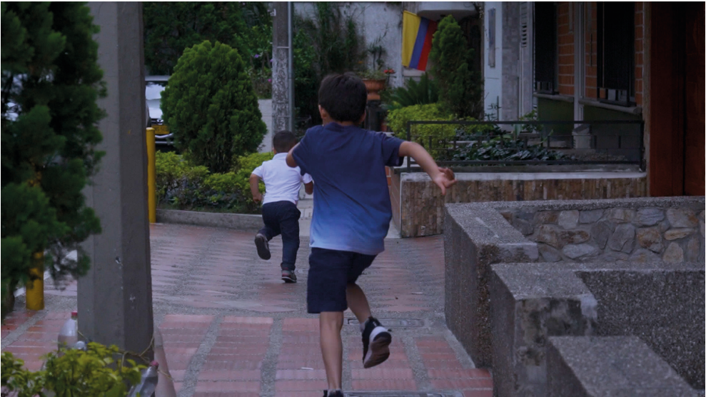
Fotografía: los hijos del Barrio Malta Archivo fotográfico: Carlos Fernando Tobón Olarte Año: 2022