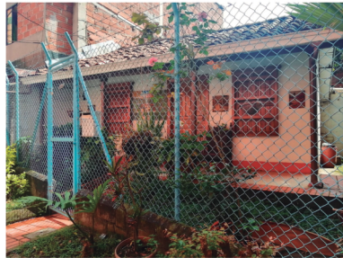
Casa familia Echeverry.