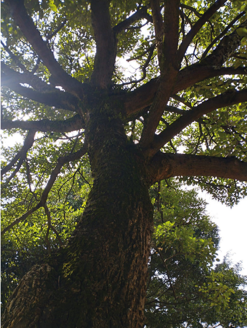
Fotografía: Búcaro, sector El Carmelo, ribera de la 48 Año: 2022