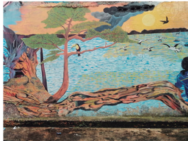
Mural artístico. Autor: Germán Botero "El tío"

Fotografía: Collage, barrio Guamalito Año: 2022