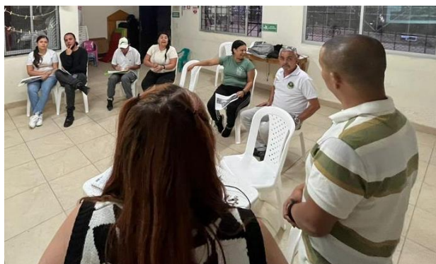
Imagen 4. Reunión con mesa Ruta en memoria de la Alfarería.

Se creó una mesa con los presidentes o líderes de los barrios el Porvenir 3, El Pesebre, Los Florianos, y de las veredas El Ajizal y Los Gómez, que es por donde se proyectó la ruta, esto con el fin de socializar e implementar los proyectos que se propongan.