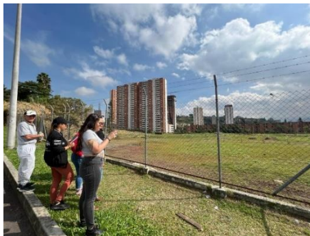
Imagen 9. Galpón Medellín.