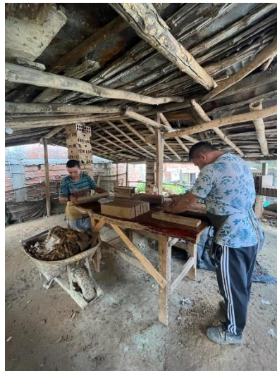
Imagen 15. Chircal el Llano.