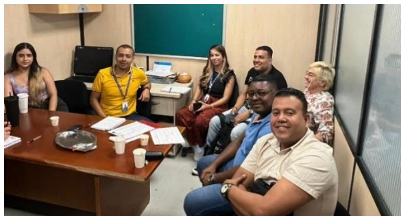
Imagen 2. Reunión con Afroyakaar.

En esta fase se realizaron reuniones para crear un plan de acción con la comunidad afroyakaar donde se va a socializar, diseñar y rediseñar lo que va de la ruta rincón del pacífico, esto desde la planificación comunitaria, con el fin de atraer la cultura afro mediante la creación de un biovivero y un aula ambiental, también realizar acompañamiento o seguimiento con el tema del grafisur y el restaurante.