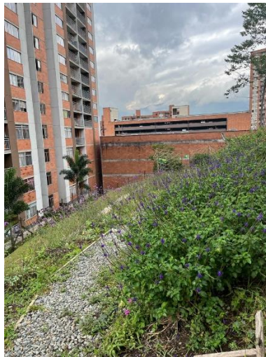
Imagen 12. Mariposario.