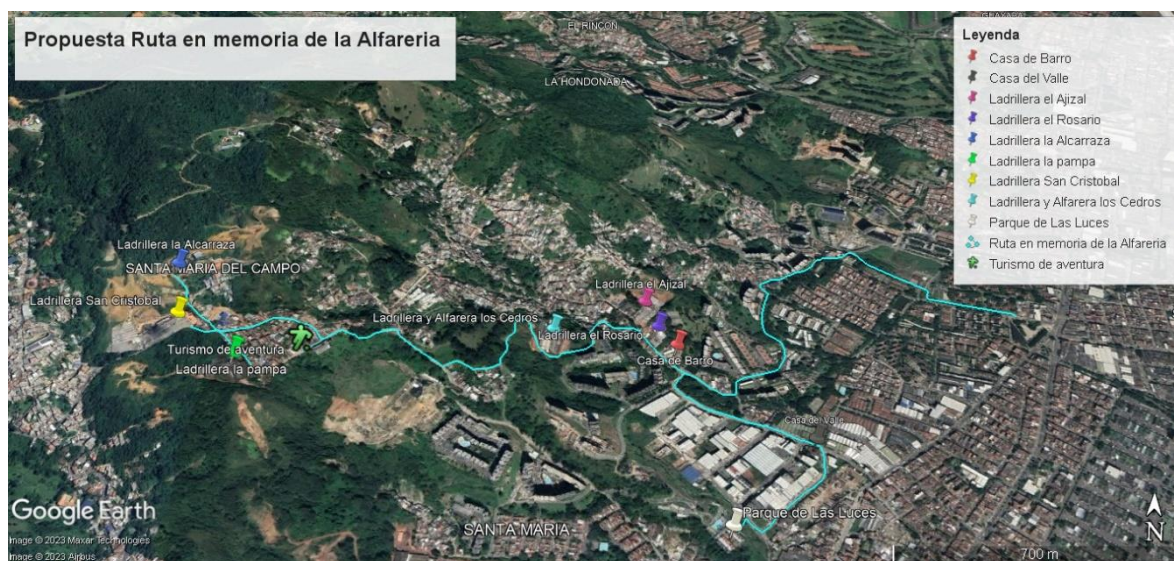
Imagen 7. Propuesta de la ruta alfarera.

Se llevó la primera propuesta de la ruta donde la comunidad pudo hacer parte de la formulación de esta, indicando que les gusta y que no. Se le realizó la invitación a toda la comunidad del corregimiento en general pero la mayor participación fue de los líderes de los barrios el Porvenir 3, El Pesebre, Los Florianos, y de las veredas El Ajizal y Los Gómez ya que en estos barrios está proyectada la ruta. La ruta solo existía de nombre, es así como desde la administración llevamos la primera propuesta de la ruta (Imagen 7), en la que todos los presentes estuvieron de acuerdo con la misma, ya que se propuso estratégicamente para que se presentara por lugares como las ladrilleras el Ajizal, El Rosario, La Alcarraza, Parque de Las Luces y El Chircal El Llano, que es el único chircal que aún se encuentra en funcionamiento en el municipio, estos son lugares de gran importancia en la historia de la alfarería local.