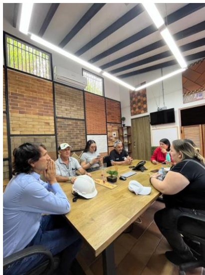
Imagen 11. Encuentro en Casa Medina.