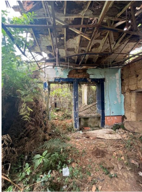
Imagen 14. Casa Flandes.