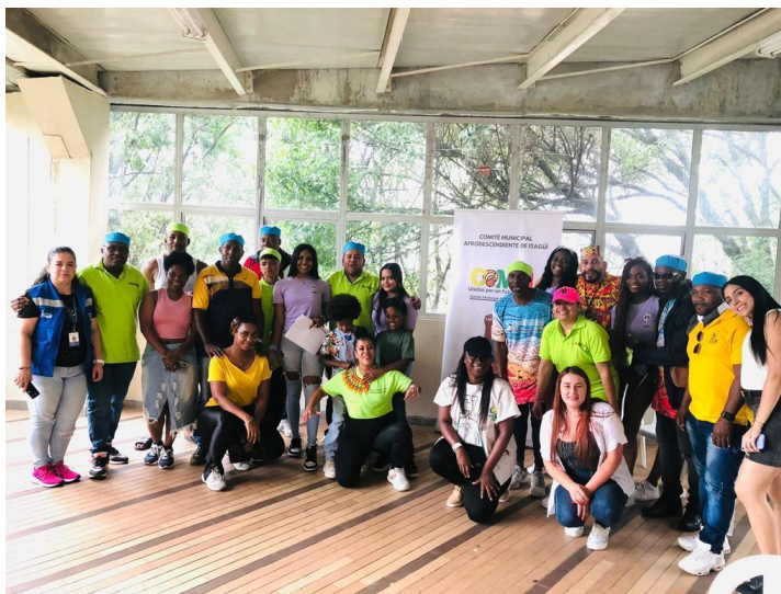
Imagen 3. Reunión a cargo de Corantiquia.

Con Corantiquia se realizó una primera reunión donde se definió que es un vivero, que beneficios trae a la comunidad, tanto económicos como ambientales, y como se iba a realizar.