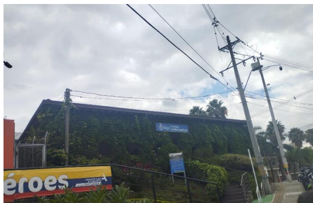
Imagen 13. Secretaria de Medio Ambiente.