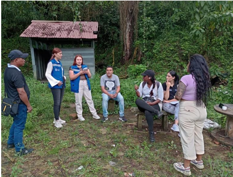
Imagen 5. Visita al predio y reunión con Corantioquia para implementación del vivero.

Este proceso ha crecido y va por muy buen camino, ya que la comunidad ha tomado fuerza y se ha apropiado del territorio, en ese sentido, el proyecto ya comenzó y se hizo el cerramiento del predio, igualmente se han presentado problemáticas en el sector, tales como el tema de las basuras en el terreno, plagas y personas que hacen uso del espacio sin autorización.