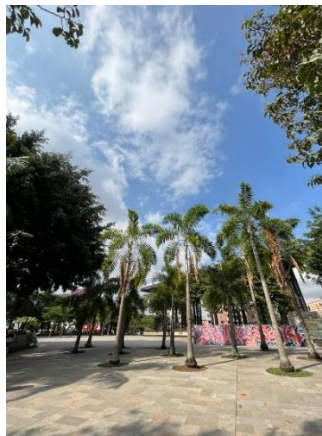
Imagen 8. Parque de las chimeneas.