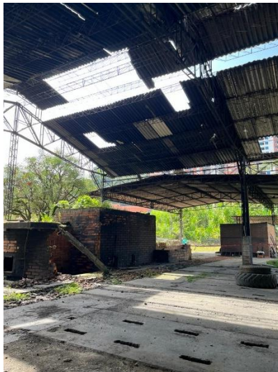
Imagen 10. Galpón Antioquia.