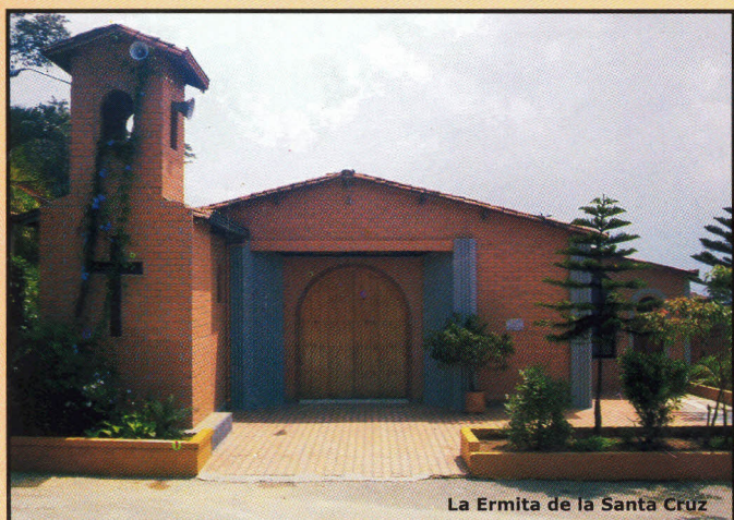
La Ermita de la Santa Cruz