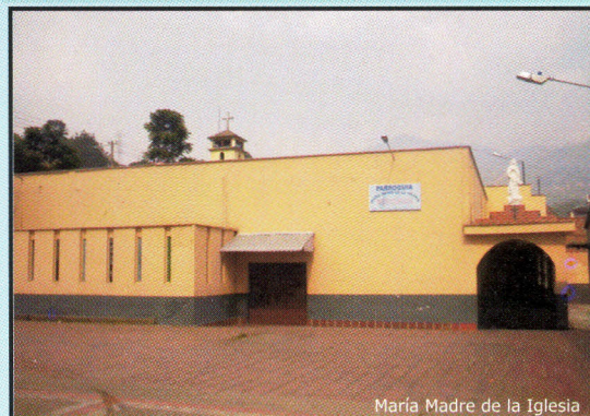
Maria Madre de la Iglesia

Fiesta Patronal: 8 de diciembre. Fiesta de la Inmaculada Concepción.