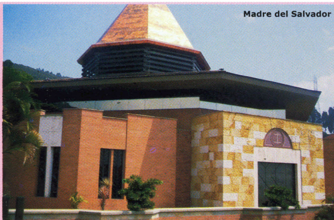
Madre del Salvador