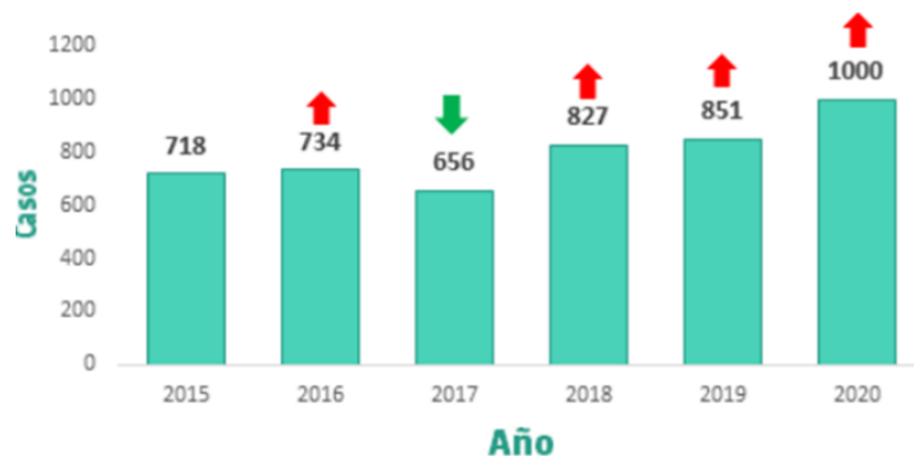
Figura 2 Indicadores casos de violencia de género Itagüí 2015-2020

Nota: Fuente Observatorio de Inclusión y Equidad para la Mujer (junio, 2021)