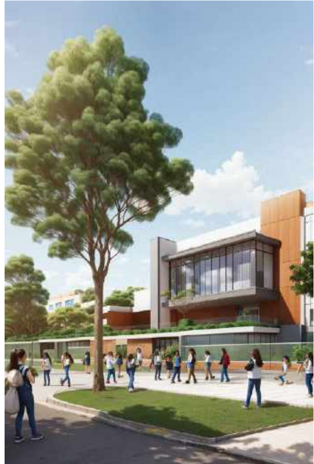
Imagen de referencia megacoledios en Itagüí.

✓ Gestionaremos con el Gobierno Nacional y el Área Metropolitana del Valle de Aburrá los recursos necesarios para la construcción de nueva infraestructura educativa, a través de la cual dejaremos atrás el déficit existente de metros cuadrados por estudiante en el aula, lo cual nos permitirá implementar en un setenta (70 %) la estrategia de Jornada Única en Itagüí para el año 2027. A su vez, un porcentaje tan importante de implementación nos permitirá ampliar las horas destinadas a formación integral cognitiva, socioemocional y ciudadana, a través de programas diversificados que aprovechen los laboratorios, bibliotecas, centros de cómputo y espacios deportivos de cada uno de los colegios. En igual sentido, un transparente ejercicio de contratación y supervisión nos permitirá tener uno de los mejores modelos de alimentación escolar de Colombia, tanto en cobertura como en calidad de los alimentos, lo cual impactará positivamente