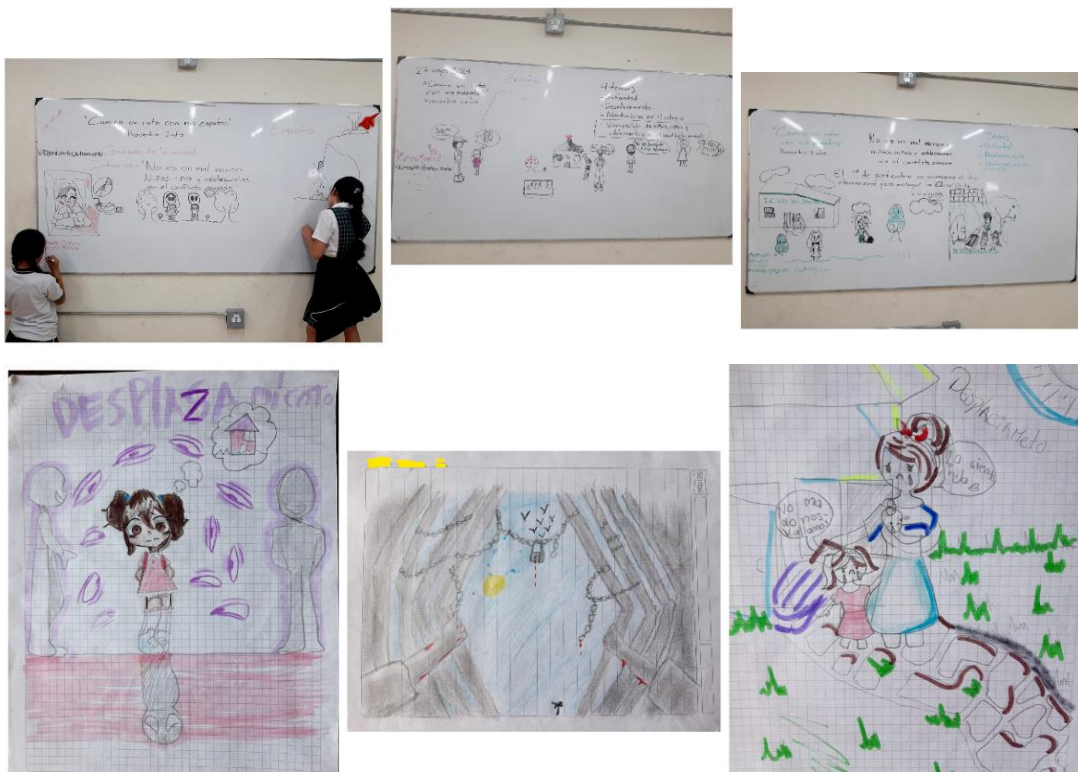
Figura 5 Representación del Volumen de la CEV Fotografías propias, 2024

De tal manera la espontaneidad limitada con la planeación de las clases fue algo que surgió, acorde a sus preferencias artísticas, manuales y diferentes habilidades de los estudiantes en los que ellos podían proponer a partir de sus gustos, esto permitió un acercamiento que dio cuenta de diferentes formas en que ellos entendieron sobre el conflicto armado.