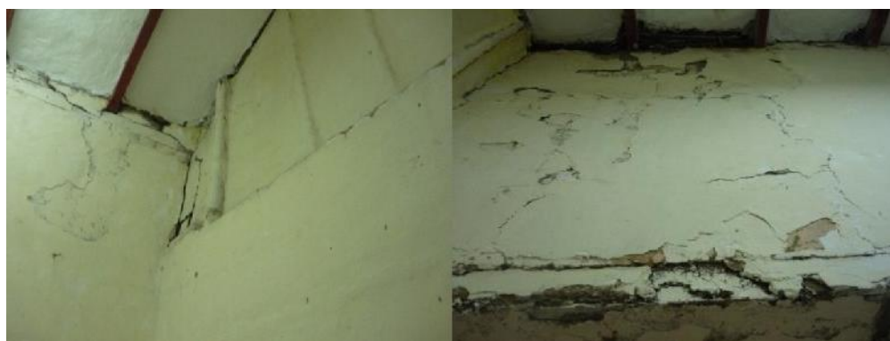
En La Finca existe una PYME comunitaria, no un proyecto Cultural acorde a un BIC. La casa presenta alto deterioro.