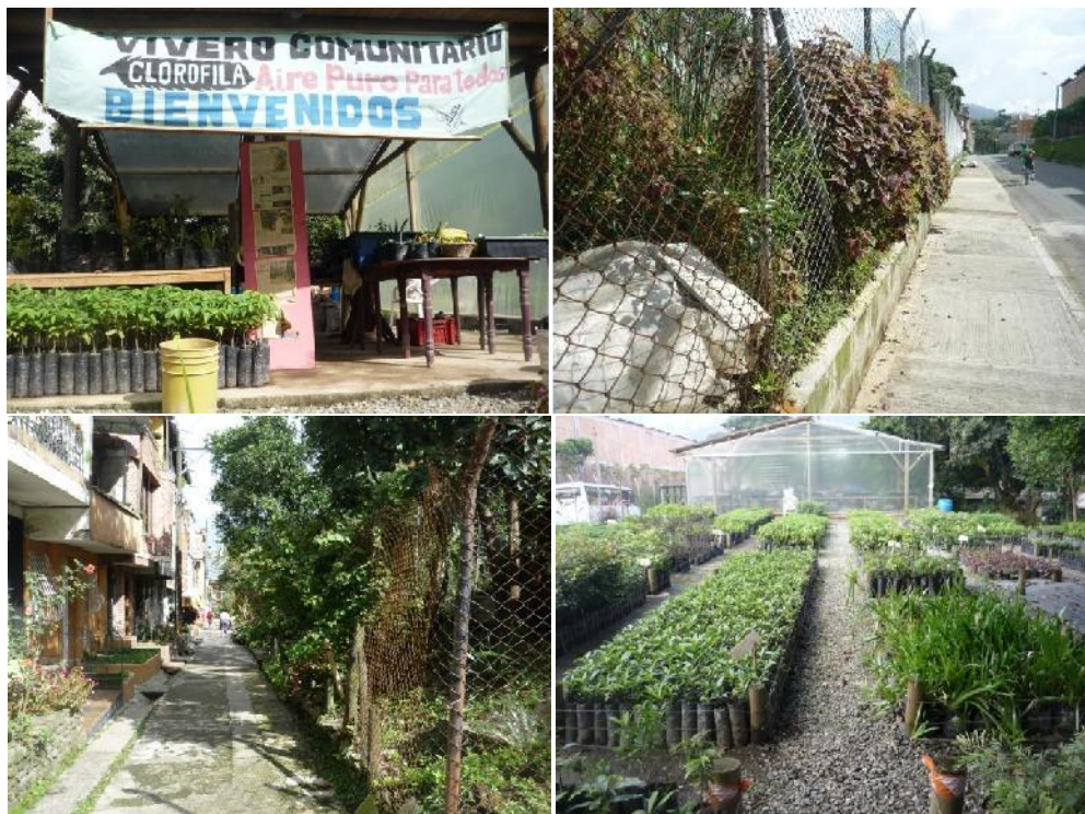
A raíz del desarrollo urbanístico de Suramérica, se accede a La Finca a través del "Vivero Comunitario Clorofila"