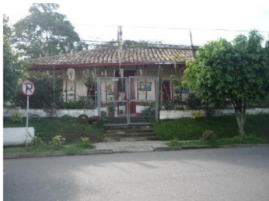
Aviso, Conjunto Residencial "La Finca", en Monografía Actualizada de Itagüí, 1986