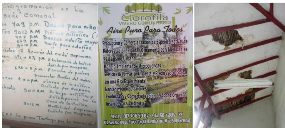
Tres caras del uso, aprovechamiento y abandono del BIC, 2011

Luego fue considerada patrimonial mediante el Acuerdo 020 de 2007 (POT 2007), ratificada como Bien de Interés Cultural Municipal (BIC-M). Se encuentra en el listado en el Decreto 259 de junio 2000 (POT 2000) igualmente como Bien de Interés Cultural.