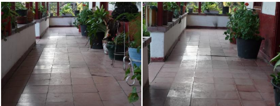
Abundan materos y plantas para el adorno y la venta. Pero el piso se hunde a la vista.

La Ley 743 de 2002, plantea como definición de acción comunal, “una expresión social organizada, autónoma y solidaria de la sociedad civil, cuyo propósito es promover un desarrollo integral, sostenible y sustentable construido a partir del ejercicio de la democracia participativa en la gestión del desarrollo de la comunidad” 2 .