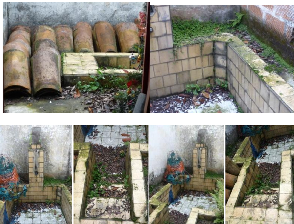
El hermoso baño de inmersión y su íntimo entorno son un basurero, 2011

p) Los demás que se den los organismos de acción comunal respectivos en el marco de sus derechos, naturaleza y autonomía.