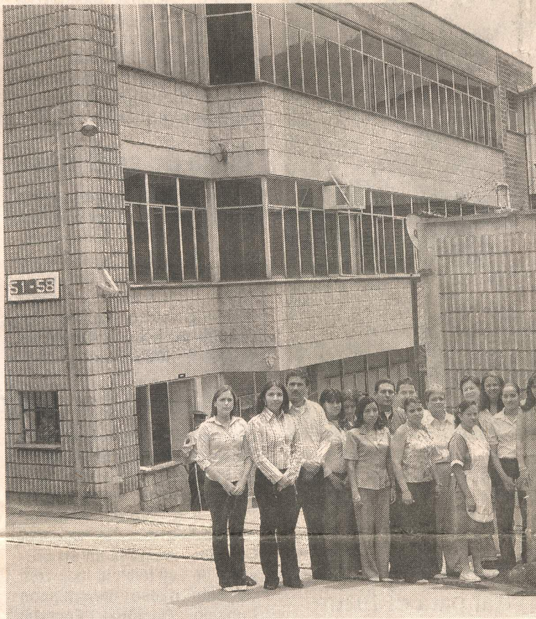
El personal que labora en la Cooperativa Recuperar se encuentra altamente calificado

En aquel tiempo el Municipio de Medellín tomó la decisión de dar una solución técnica al problema de las basuras cerrando el botadero por ser un foco de contaminación ambiental y una problemática