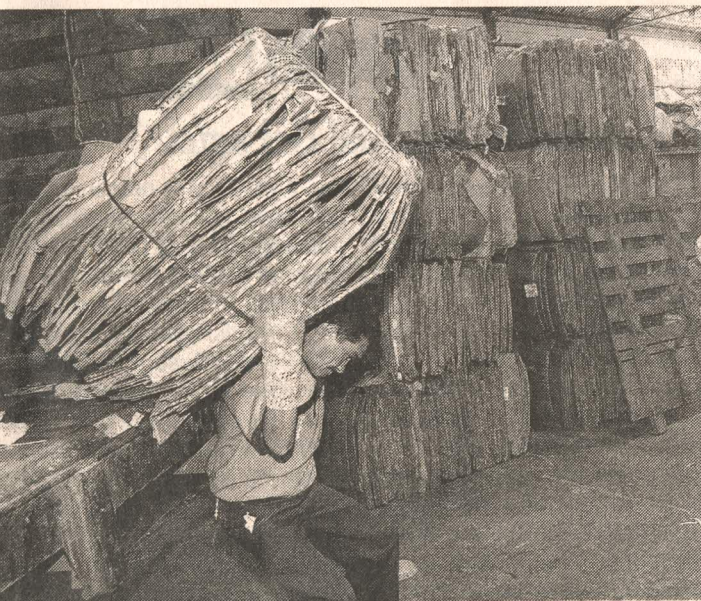
personal de planta se esfuerza por mantener el lugar impecable.