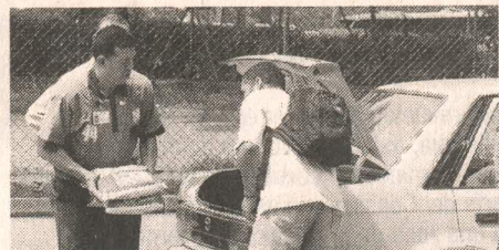
Gente con disposición en todo momento es lo que caracteriza a los equipajeros de Recuperar.