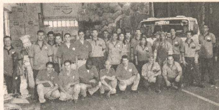
Los asociados de la planta contribuyen de manera constante al mejoramiento del ambiente.